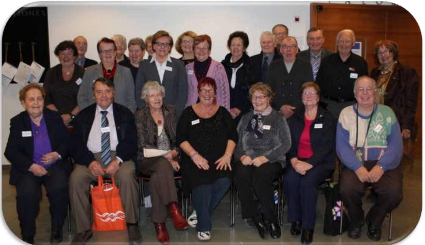
Ikäihmisten kansalaisraadin osallistujat

Raportti on saatavilla internetistä osoitteesta: http://www.uwasa.fi/citizensvoice